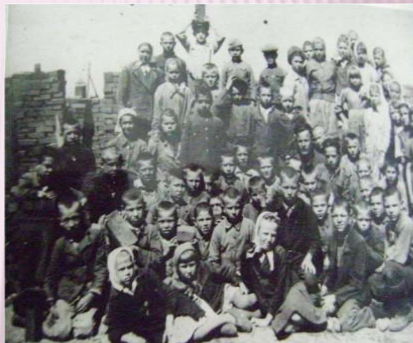
Ученики школы №32

Из газеты «Берёзовский рабочий» от 5 июня 1942 года