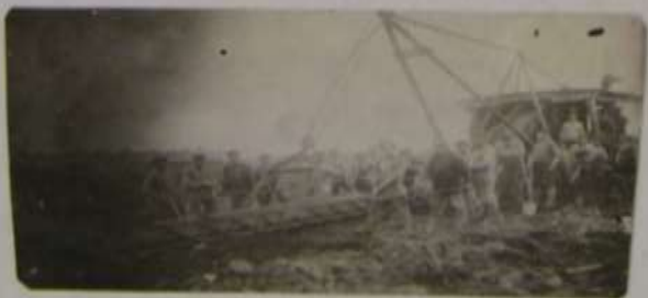
Бригада по добыче торфа у элеваторной машины

Добывал торф для военных заводов Свердловской области, на его базе работал Ленинградский ВНИИ торфяной промышленности.