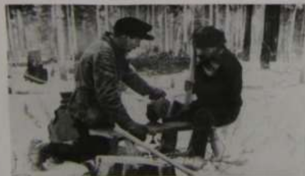
Точильщик топоров на лесосеке

Выполнял правительственные заказы на изготовление лыж, прикладов, ящиков для снарядов, санок-ледянок.