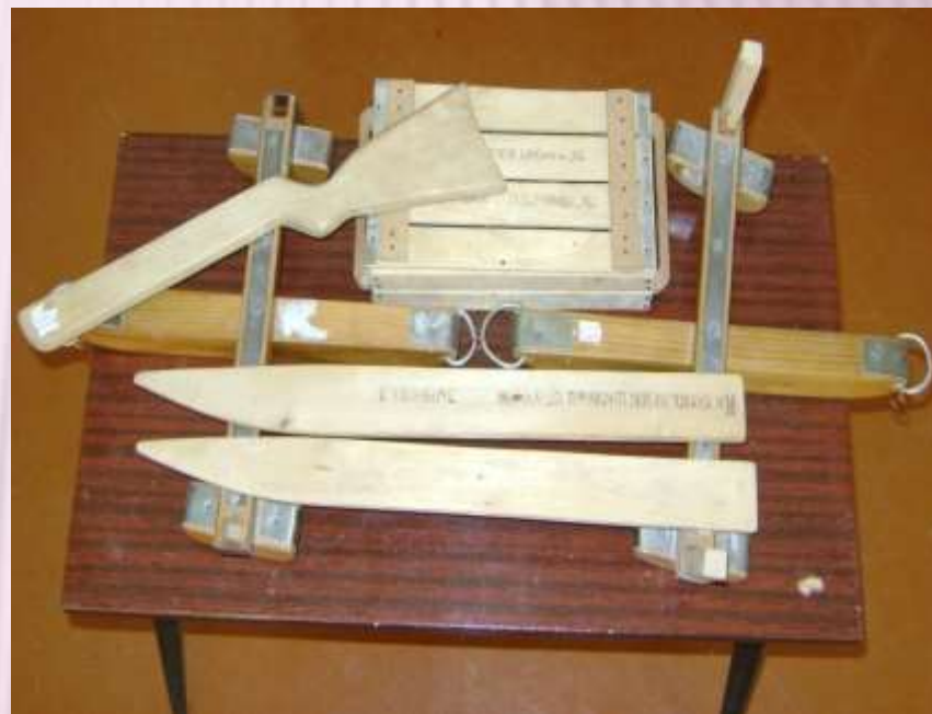
Макеты продукции лыжного цеха