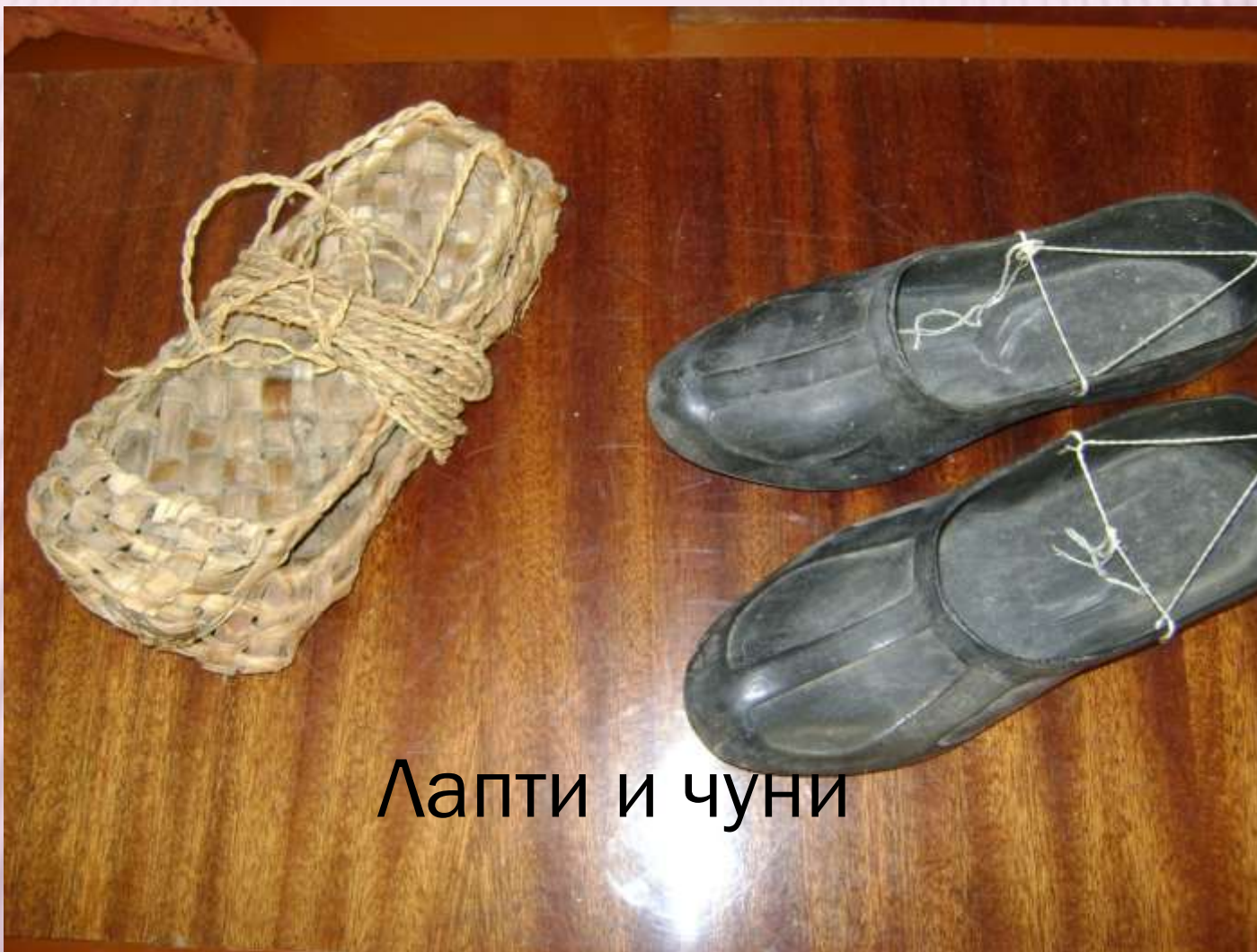
Лапти и чуни