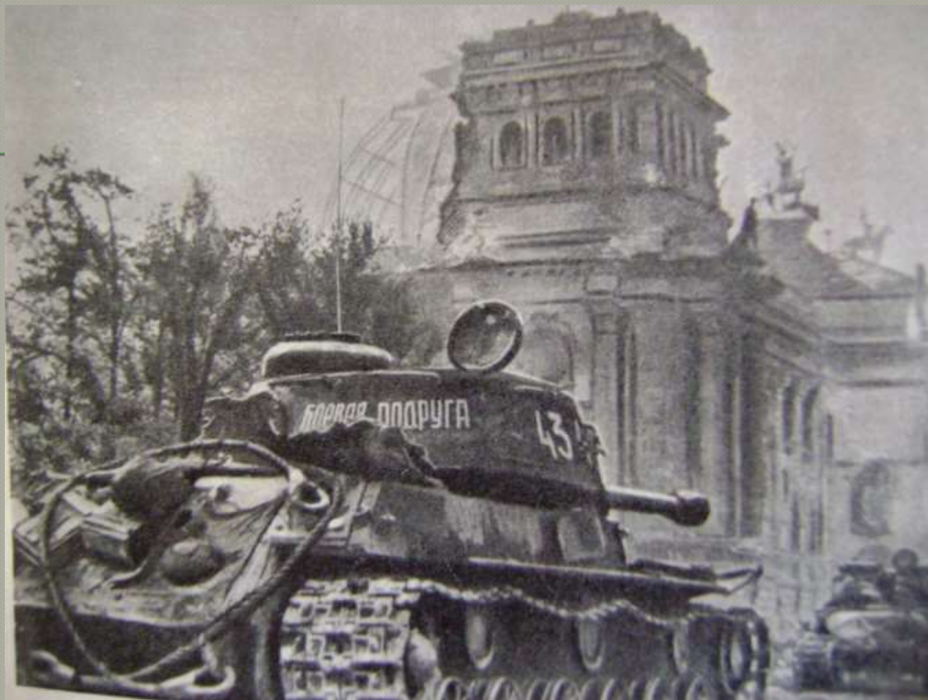
Уральские танки в Берлине