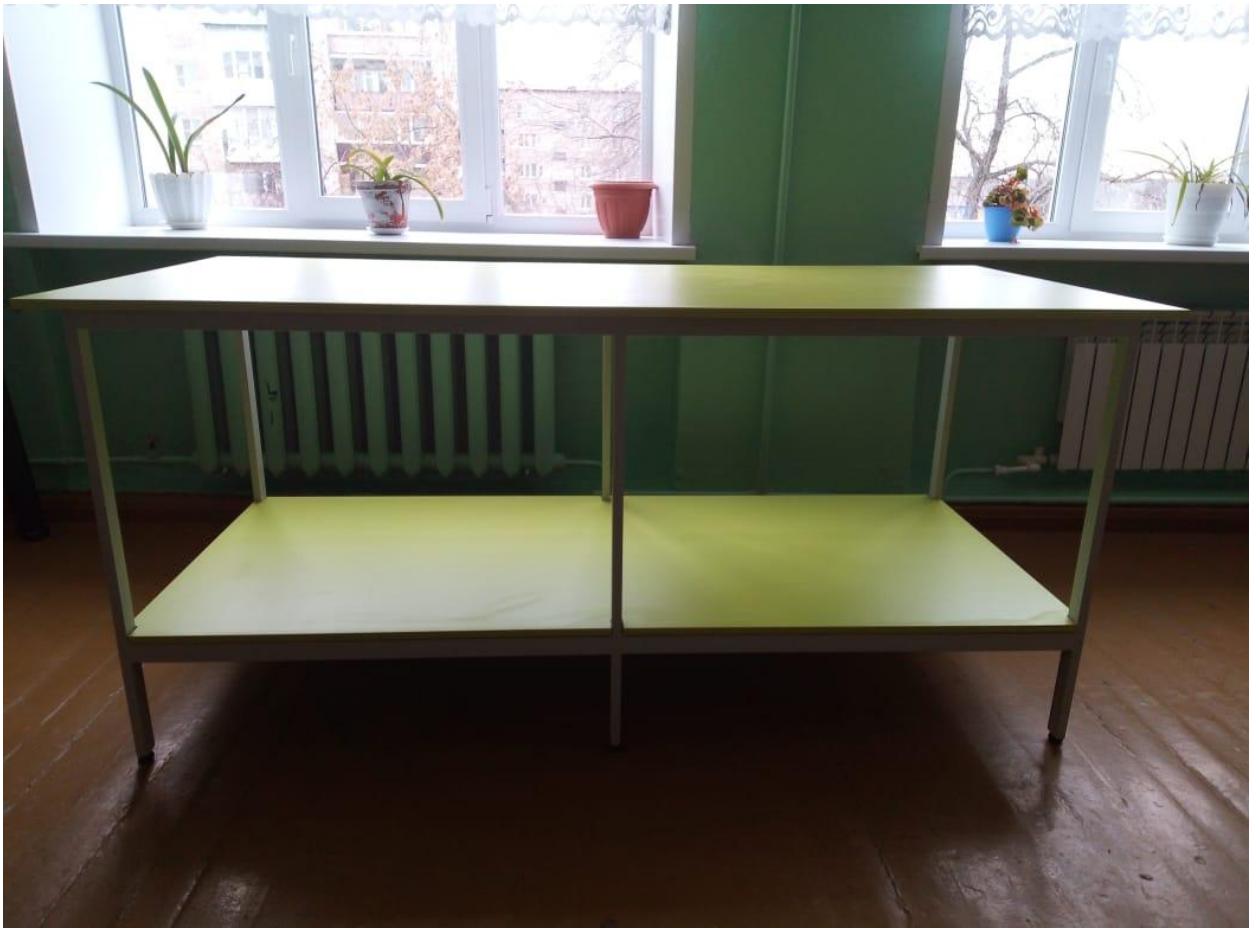
Приложение № 8: Стол для раскроя в кабинете технологии девочек