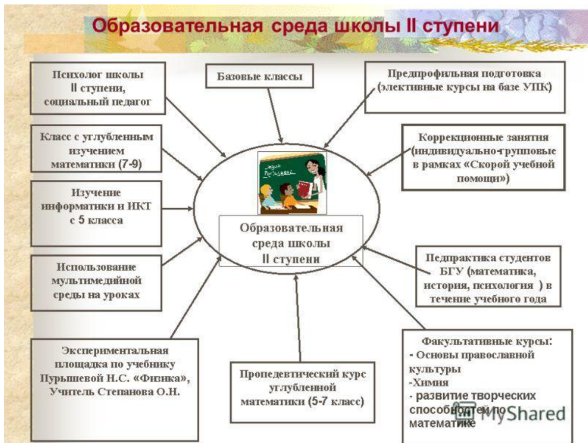
Рисунок 1. Примеры поддерживающей учебной среды и её ключевые аспекты