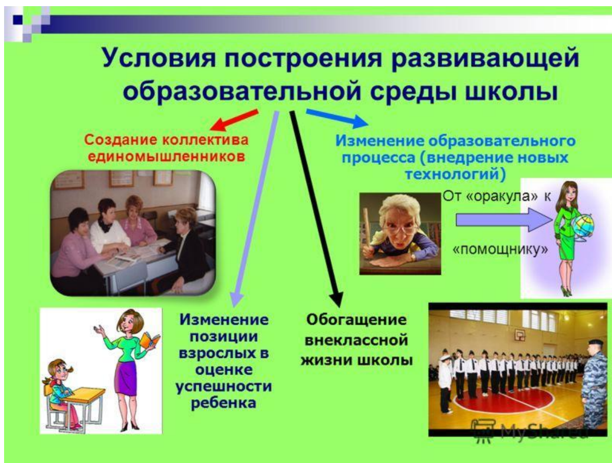
Рисунок 2. Примеры поддерживающей учебной среды и её ключевые аспекты

Создание поддерживающей учебной среды в школе является необходимым условием для успешного обучения и гармоничного развития учеников. Эта среда включает в себя все аспекты, которые способствуют или, наоборот, мешают образовательному процессу. На практике образовательная среда рассматривается как "третий учитель", наряду с педагогами и родителями.