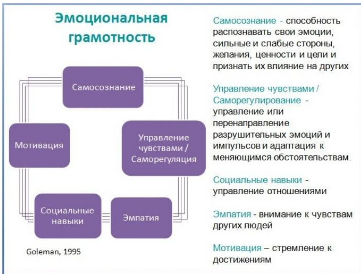
Рисунок 3. Схемы и таблицы, иллюстрирующие концепции эмоциональной грамотности