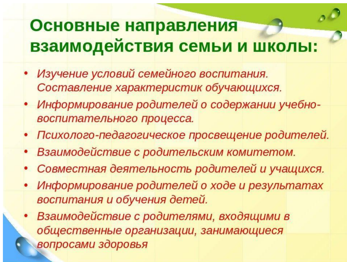
Рисунок 8. Основные направления взаимодействия семьи и школы