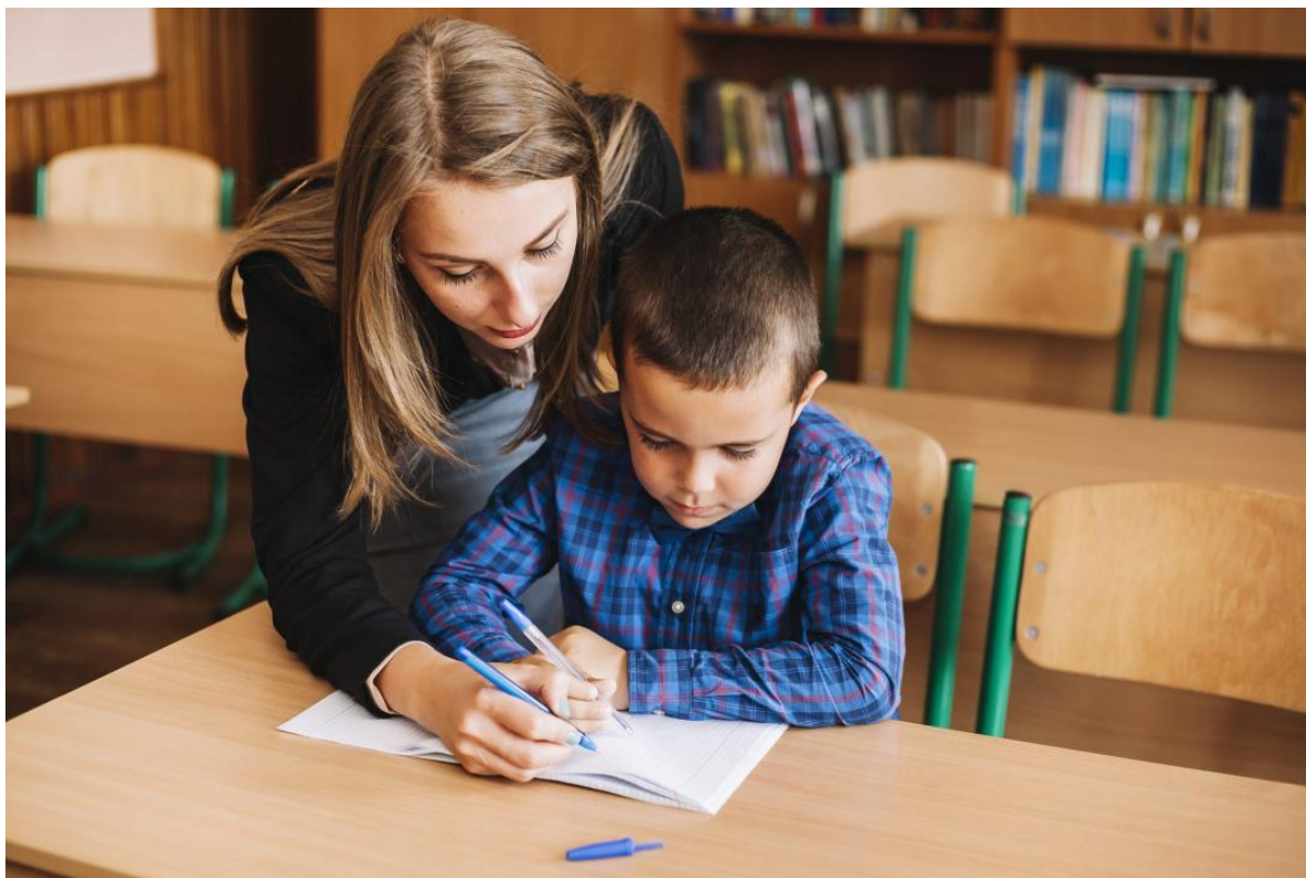
Рисунок 6. Индивидуальный подход и консультирование учеников