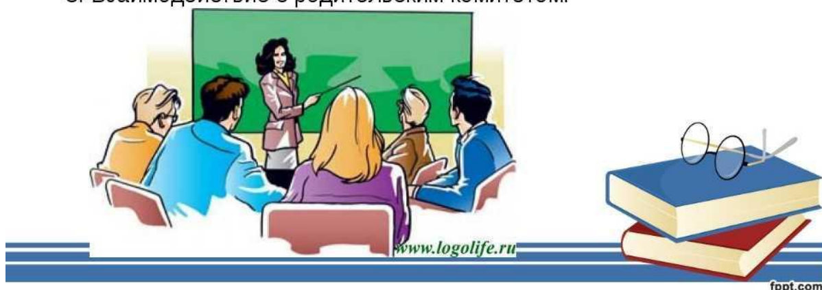
Рисунок 9. Основные направления взаимодействия семьи и школы

Взаимодействие между родителями и школой является важным компонентом комплексной профилактики негативного поведения школьников. Исследования подчеркивают, что активное вовлечение родителей в образовательный процесс способствует лучшему пониманию их детьми учебной среды и предотвращению конфликтов [29]. Партнерство между школой и семьей позволяет создать поддерживающий контекст, где каждый участник понимает свою роль и ответственность.