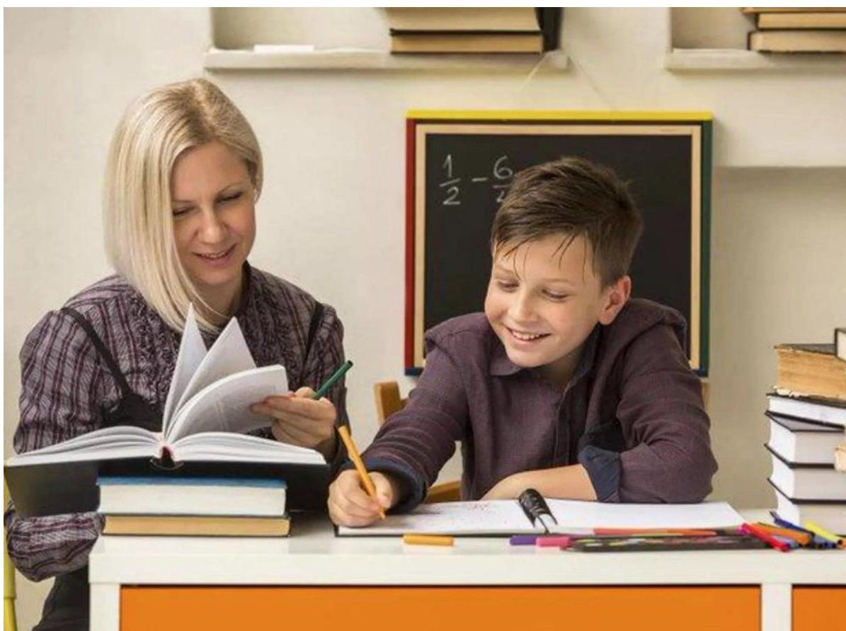
Рисунок 7. Индивидуальный подход и консультирование учеников

Индивидуальный подход к каждому ученику приносит значительные изменения в образование, позволяя учителям более эффективно взаимодействовать с каждым ребенком. Это особенно актуально для профилактики негативного поведения, поскольку учет уникальных потребностей и особенностей ученика может снизить вероятность возникновения конфликтов и ухудшения успеваемости. Важно осознать, что каждый ребенок — это уникальная личность, с собственными способностями, интересами и темпами обучения.