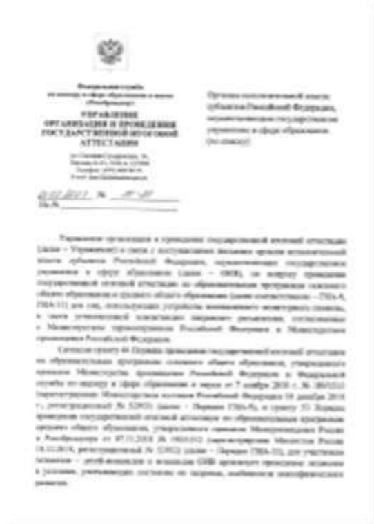
Письмо Федеральной службы по надзору в сфере образования и науки от 01.02.2023 №10-21

Учащемуся предоставляется отдельная аудитория